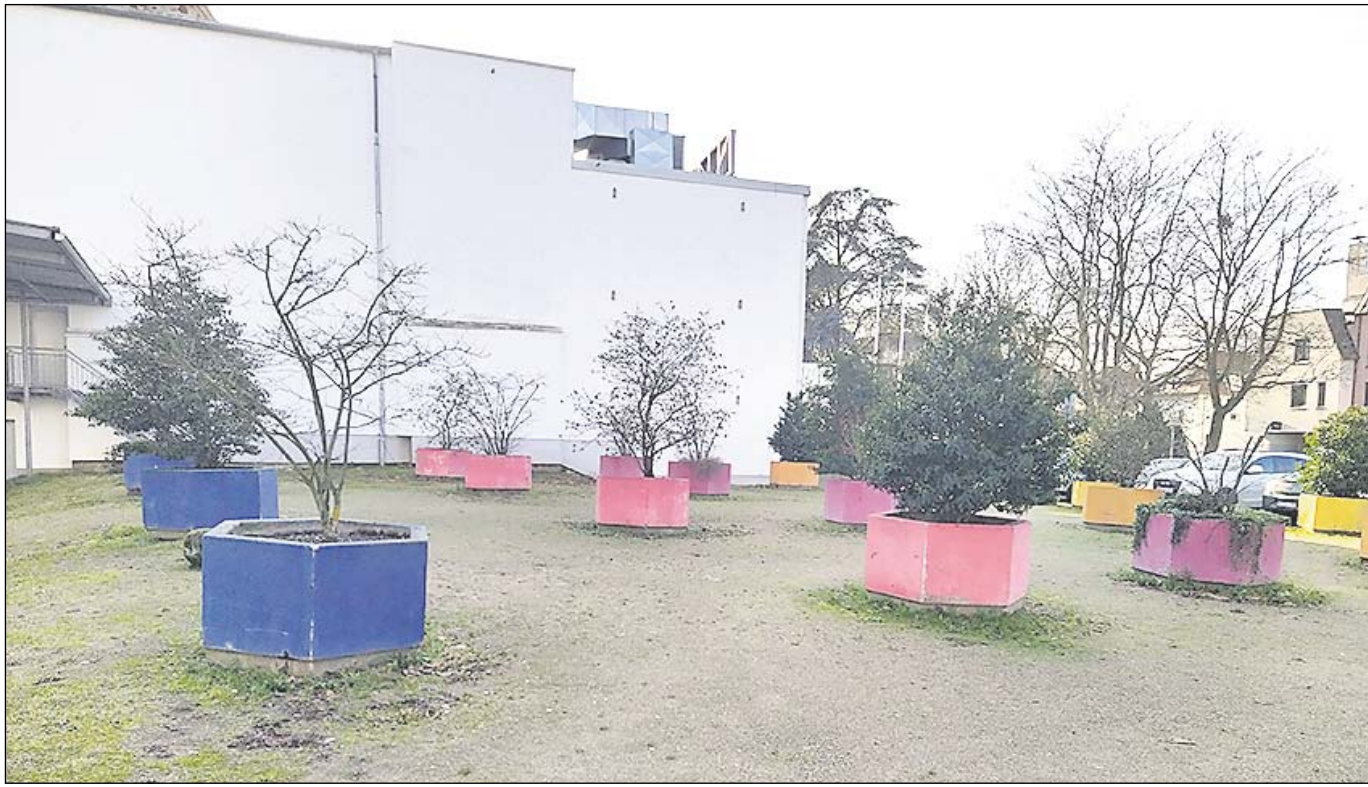
Aktuelle Ansicht des Hoffart-Geländes

Es muss nicht immer der eigene Garten sein. Diesen Gedanken greift das sogenannte „Urban Gardening“ auf, das mittlerweile in vielen Kommunen Einzug gehalten hat. Die Idee dahinter: Bürgerinnen und Bürger können sich bei der Bepflanzung innerstädtischer Flächen in Eigenregie einbringen und damit zu mehr Lebens- und Aufenthaltsqualität