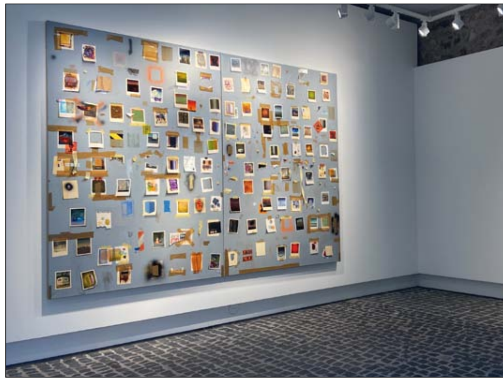
Blick auf die Ausstellung mit „Fragil, 2013/2022“ von Jochen Mühlenbrink

Weitere Informationen finden sich auf der Internetseite www.stadtkultur-bensheim.de .