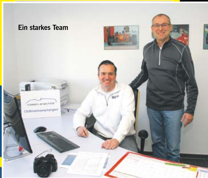
Ein starkes Team