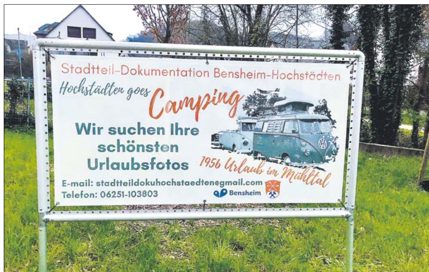
„Hochstädten goes Camping“! Mit einem Banner an der Ortseinfahrt Hochstädten sucht die Stadteil-Dokumentation Erinnerungen an die schönsten Campingurlaube.

ist ebenfalls Bestandteil der Hochstädter Ausstellung und soll mit persönlichen Erlebnissen und Erinnerungen in Form von Fotos, Postkarten und mehr angereichert werden. Das Team der Stadteil-Dokumentation freut sich daher auf Zusendungen an: stadteildokuhochstaedten@gmail.com