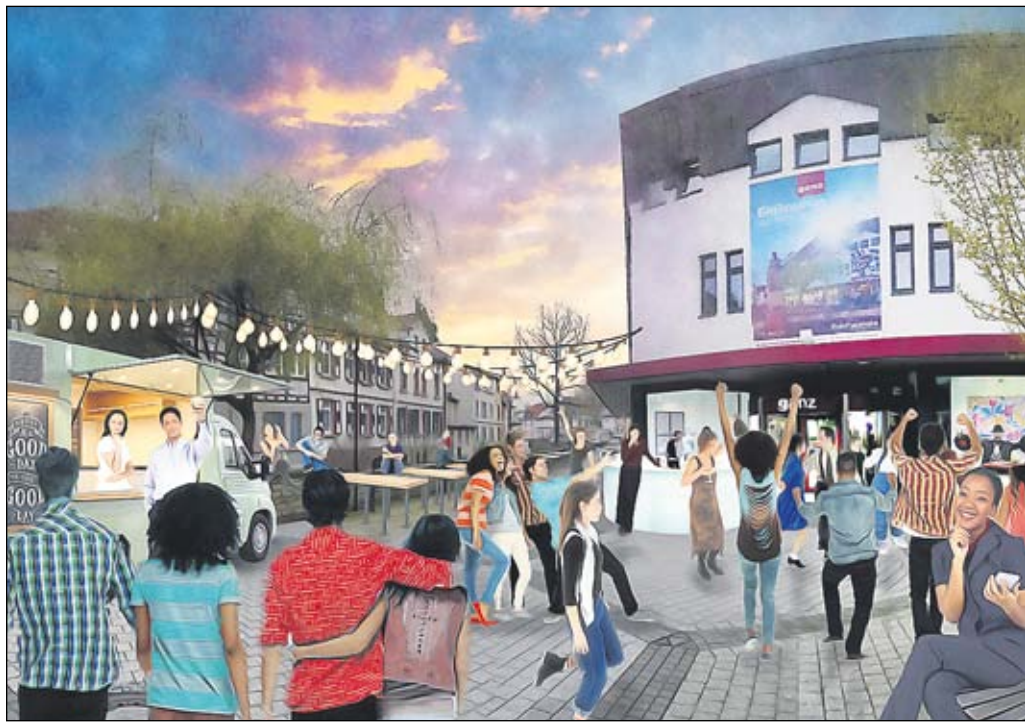
Illustration: Lauterbar, zwischen Mittelbrücke und Kaufhaus Ganz.

Zum ersten Mal in diesem Jahr findet am 1. Juni von 17 bis 21 Uhr die Lauterbar statt. Im Stile einer After-Work-Party soll sich entlang des Bachlaufs der Lauter die Fläche zwischen Mittelbrücke und Kaufhaus Ganz an diesem Abend in einen gemütlichen Treffpunkt für Jung und Alt verwandeln. Bis Oktober wird die Veranstaltung immer am ersten Donnerstag des Monats wiederholt, ausgenommen am Winzerfest.