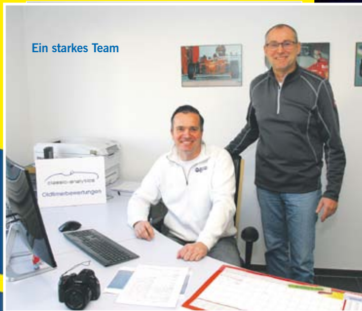
Ein starkes Team

Ihr Team an der Bergstraße, wenn es um Schaden und Bewertung geht.